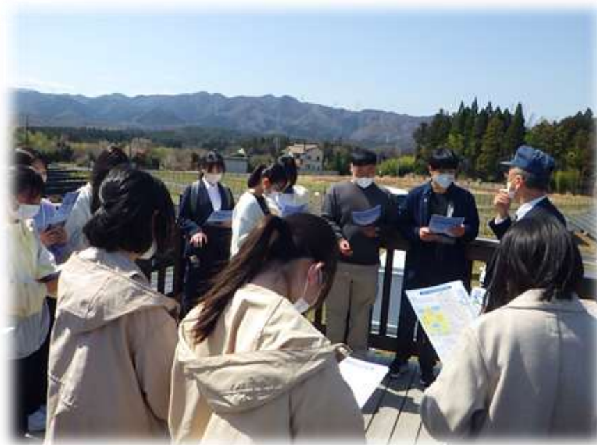
福岡県立明善高等学校の皆さん