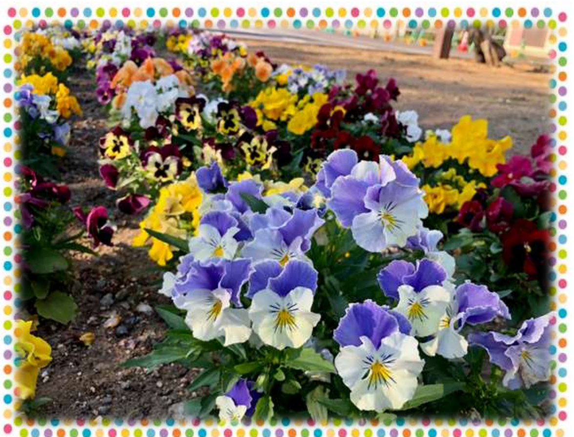
夜ノ森駅西口に咲くパンジー