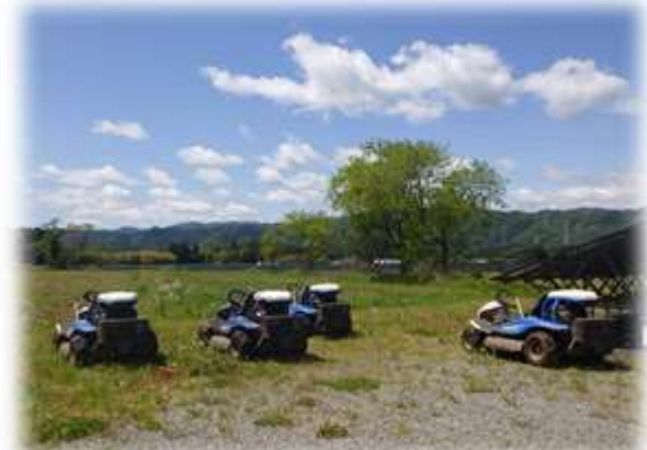
準備万端のラビットモアー