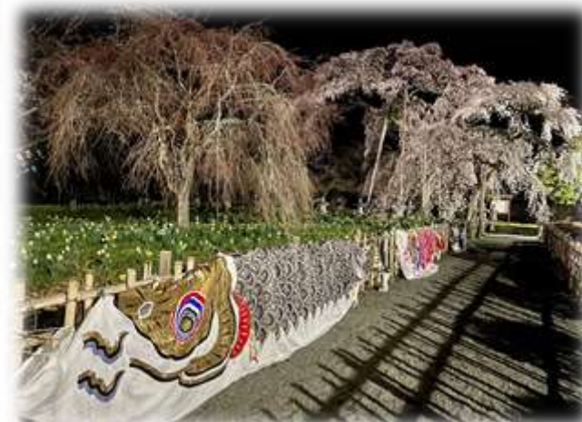
宝泉寺の紅枝垂桜と鯉のぼり