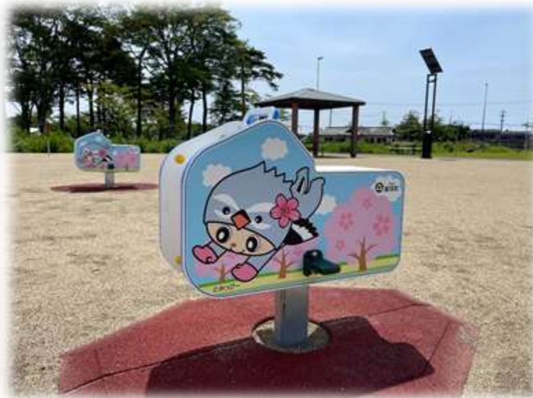
新しくなった夜の森公園