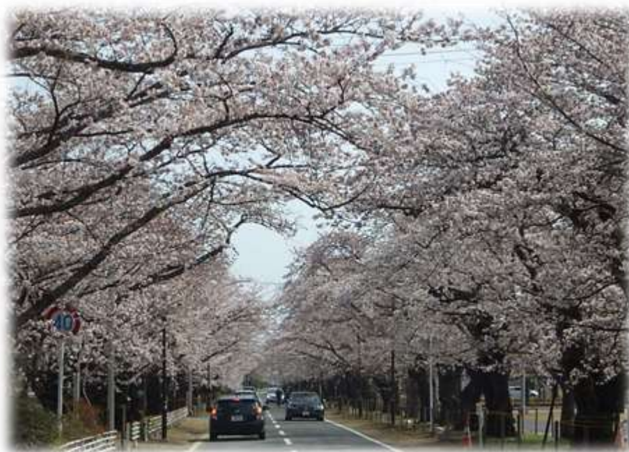
昨年より一週間以上早く開花宣言された夜ノ森の桜のトンネル