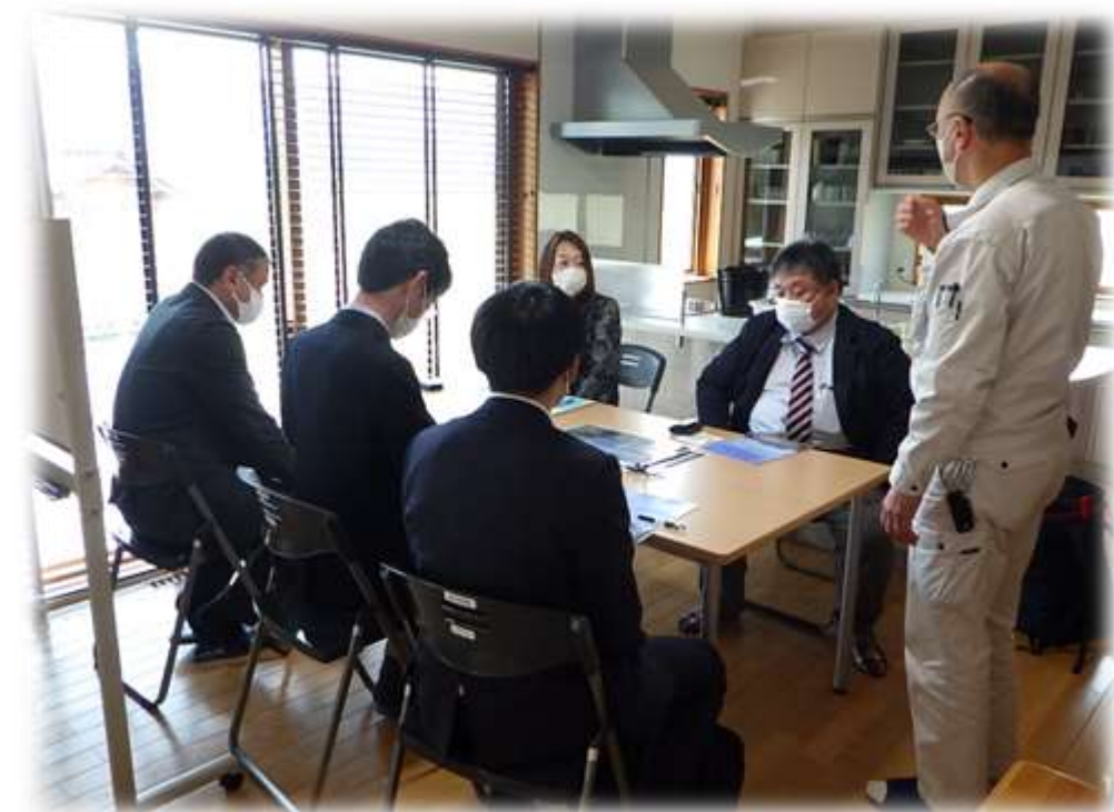
福島県連合会の皆さん