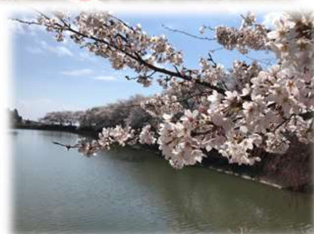
檜葉町上繁岡のため池の桜