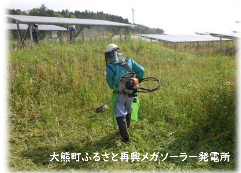
大熊町ふるさと再興メガソーラー発電所