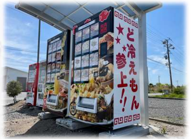
ガソリンスタンド横の自販機