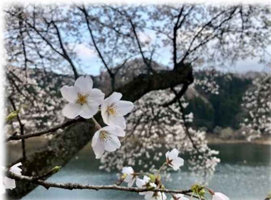
大熊町 坂下ダムの桜