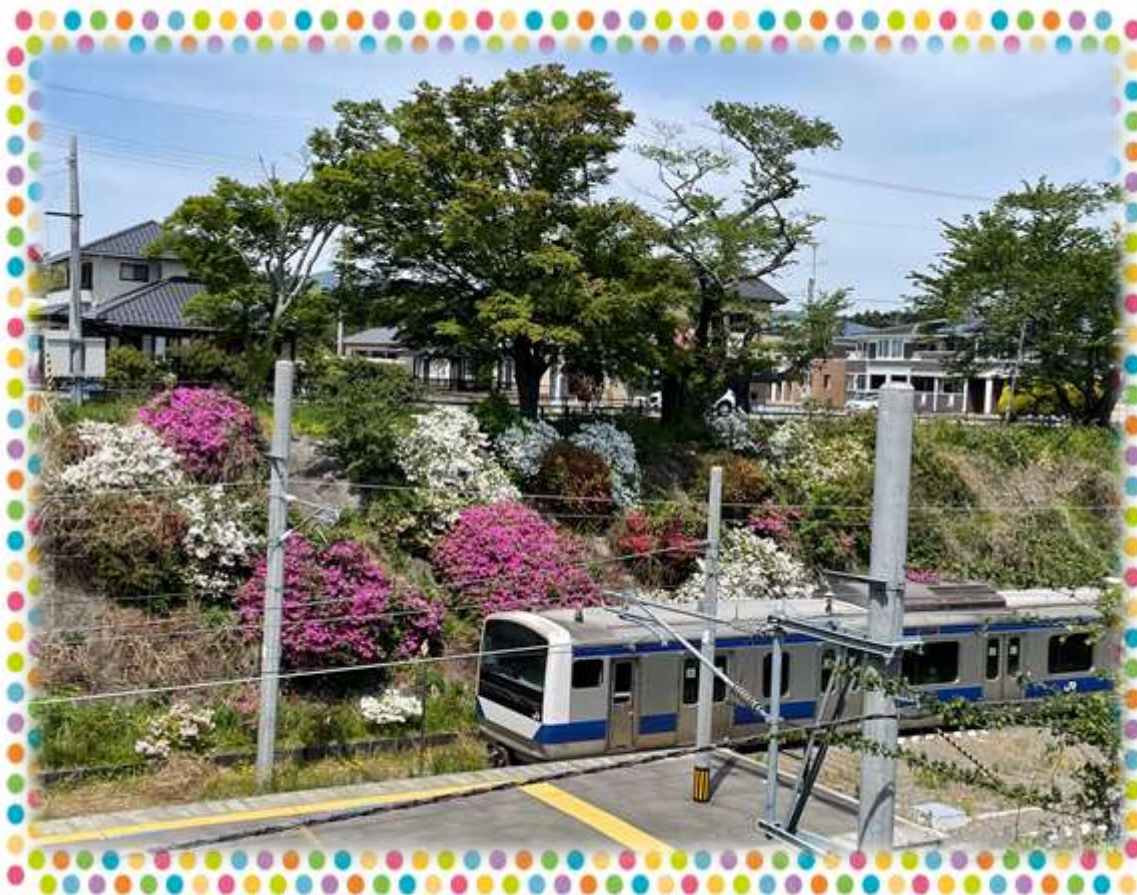
常磐線と夜ノ森のツツジ