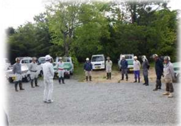
毎朝の作業前周知会