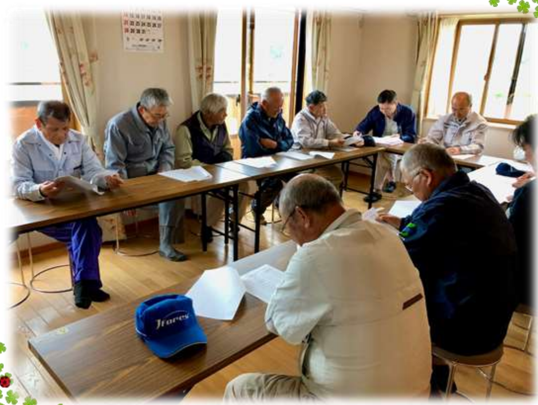
初日の打合せのあと、今年は無事に除草作業を行うことができました

5月15日から富岡復興メガソーラー・SAKURAの除草作業が始まりました。毎年お世話になっている作業員メンバーが集結し、今年も10月下旬まで作業を進めていく予定です。5月から30℃を超える季節先取りの暑さになる日もありました。熱中症に気を付けながら、無事故で作業が完了できるよう進めて参りますので、どうぞよろしくお願いいたします。