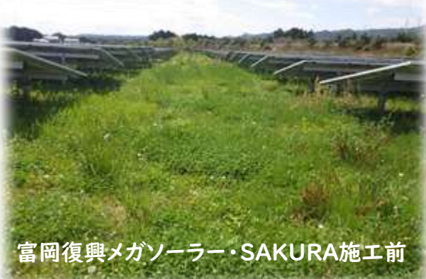
富岡復興メガソーラー・SAKURA施工前