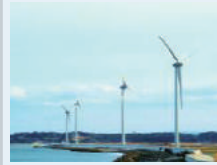
万葉の里 風力発電