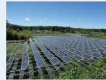
えこえね南相馬 ソーラーヴィレッジ