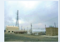
そらまIHIグリーン エネルギーセンター

利用バス会社: ケイエム観光バス 添乗員: 同行致します 宿泊施設: Jヴィレッジ 食事: 朝食1回 昼食2回 夕食1回